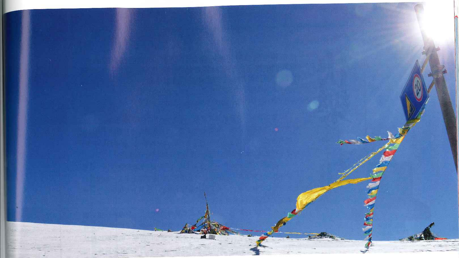
到青海的偏遠村落進行項目評估，路上白雪皚皚，荒涼一片。